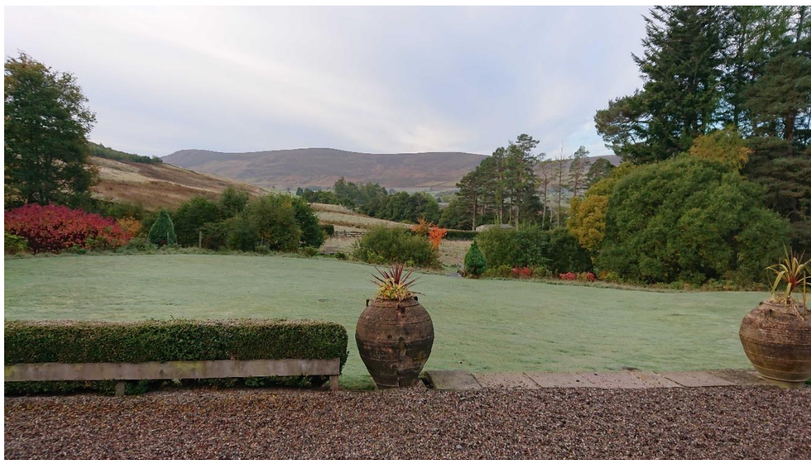
Utsikt från Rottal Estate

Rottal Estate ligger fågelvägen ca 80 km sydväst om Aberdeen i Glen Clova. Med bil på slingriga och smala vägar tar det ca två timmar att ta sig dit. Det är mödan värt. Vyerna är hänförande.