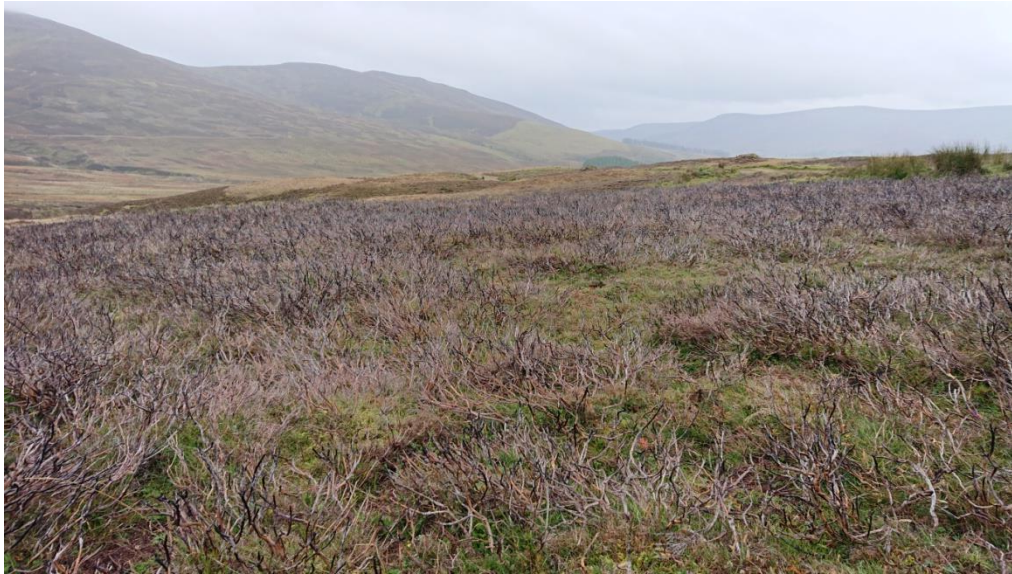
En yta av ljunng som bränts i april och som i oktober kunde uppvisa fina gröna skott