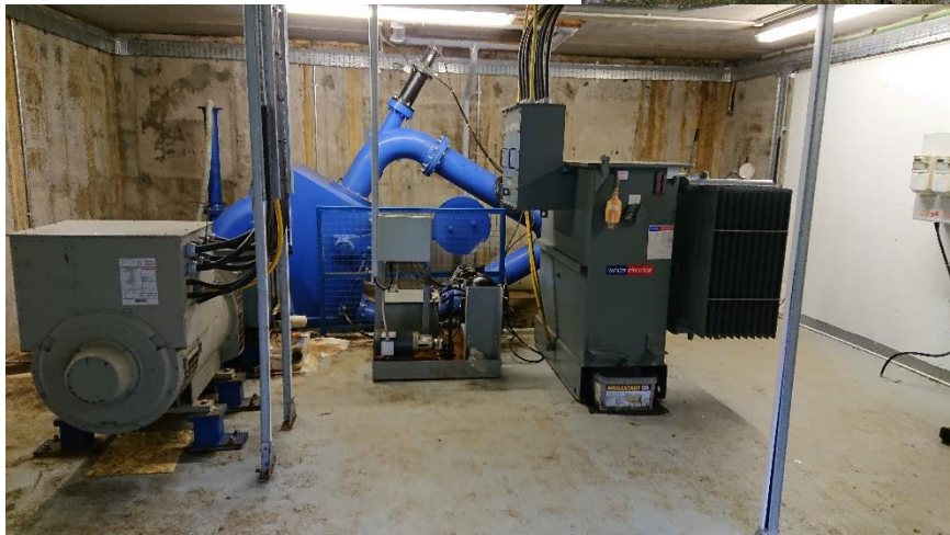
Maskinhallen i vattenkraftverket

Även för kraftverket fanns stora bidrag att hämta från EU. Eftersom man saknar ett internt nät för eldistribution såldes den producerade elen och man köpte av samma företag tillbaka det som behövdes.