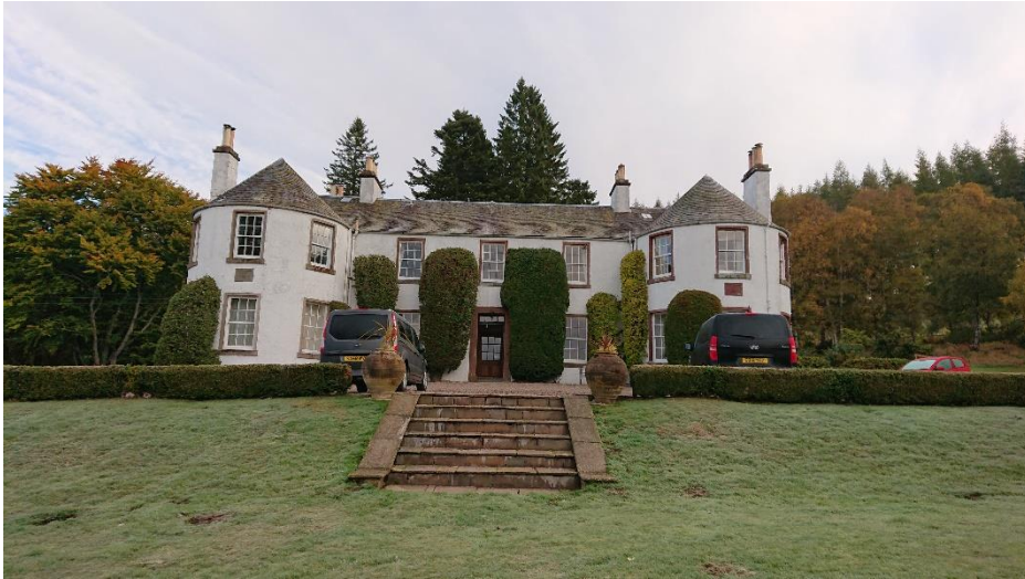
Corps de logiet från 1840