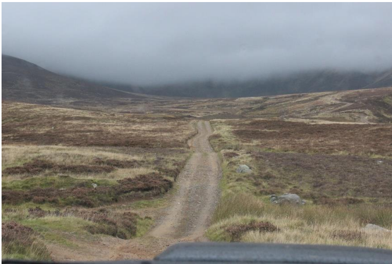
En nyanlagd väg. Observera hur fint man återställt kanterna.

Ett exempel på god framförhållning var begränsning av möjligheterna att bygga mindre vägar på egen mark. Det var tidigt känt att sådan begränsning skulle träda i kraft 2015 och Rottal Estate kunde bygga de vägar som behövdes för fårskötsel och jakt i god tid dessförinnan. När man såg dessa nya vägar kunde man tro att de funnits i alla tider. Vägmaterialet togs visserligen från berget, men på ett kärleksfullt sätt med återläggning av marksvålen. Kanske något att lära svenska byggare av skogsbilvägar?