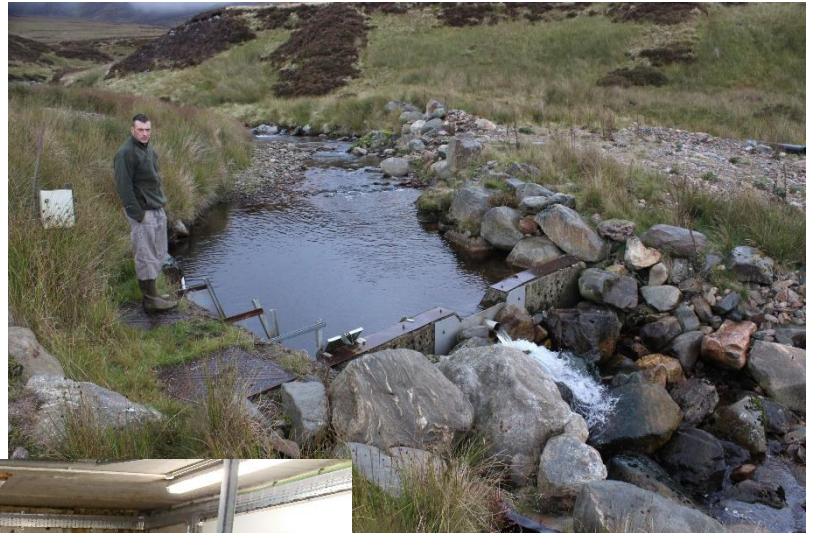
Vattenintaget (under plåtluckan) uppe i berget

Vattenkraftverket hämtar vatten från en helt oansenlig bäck uppe i bergen. Planen är att bygga en liten damm där för att säkerställa driften vid torrperioder. Vattnet leds i ett rör (ca 1 m i diameter) ner till kraftverket dit det är 2 km. Röret är nedgrävt. Fallhöjden är ca 300 m.