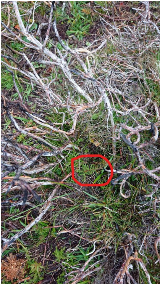
Ljungskott innanför röda ringen