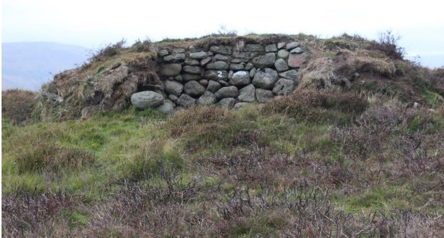
"Butt" för jakt på drivna ripor

Klappjakten på fasan och raphöns liknade det vi gör i Sverige och faktiskt också i en likartad terräng med åker, äng och skogsdungar.