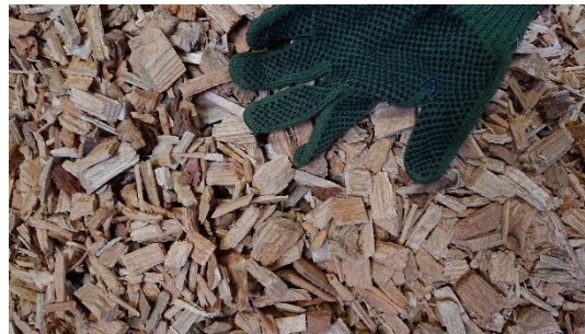
Värmepannan på Rottal Estate och hemmagjord flis

Flisen försökte man inledningsvis göra själv, men den visade sig vara lite för grov så matningen fungerade inte helt bra. Nu levererar man material för flisning och får hem flis via lastbil en gång i månaden. När flisen ska lastas av använder man ett transportband som kräver trefas elanslutning. Någon sådan finns inte i Rottal. Istället för att betala skyhöga kostnader för utbyggnad, skaffade man ett dieseldrivet elverk som levererar erforderlig elektrisk kraft. Elverket placerades på ett släp och kunde därför användas även i andra sammanhang.