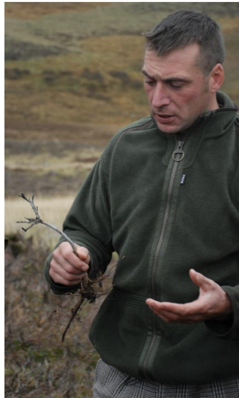
Yrkesjägaren visar resultatet av korrekt ljunngbränning, en död stjälk och en högst levande rot.